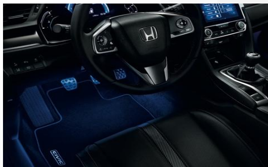
Pakiet Iluminacyjny LHD