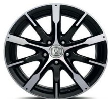
Felga aluminiowa 18'' Apollon