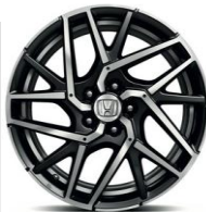
Felga aluminiowa 18'' Kratos