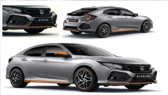
Pakiet Orange Line