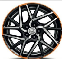
Felga aluminiowa 18'' Hexia