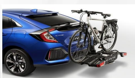
Bagażnik rowerowy Thuse EasyFold