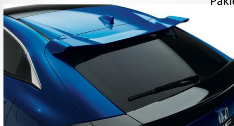
Spojler pokrywy bagażnika