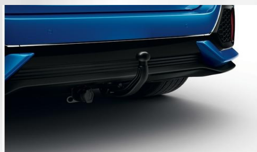
Stały / odłączany hak holowniczy