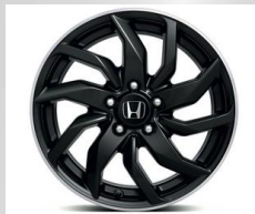
Felga aluminiowa 17'' Cura