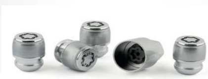
Nakrętki zabezpieczające koła (4 szt.)