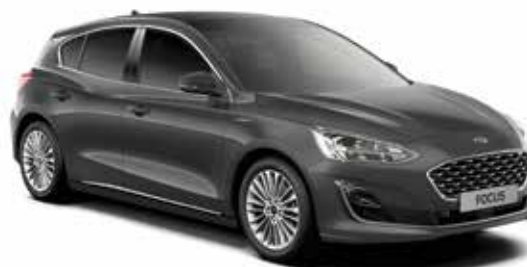
Magnetic Grey Lakier metalizowany 1 450,-