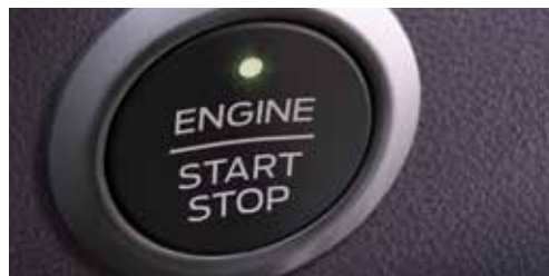
Przycisk rozrusznika Ford Power