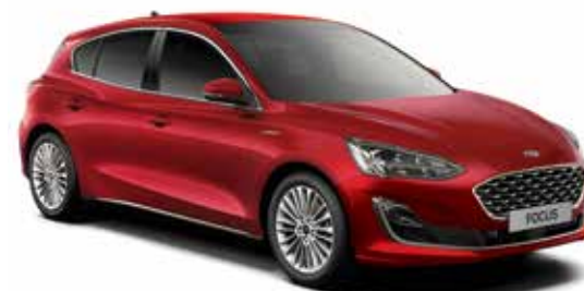
Ruby Red Lakier metalizowany specjalny 2 450,-