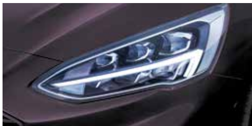
Statyczne reflektory Full LED ze światłami do jazdy dziennej LED Standard