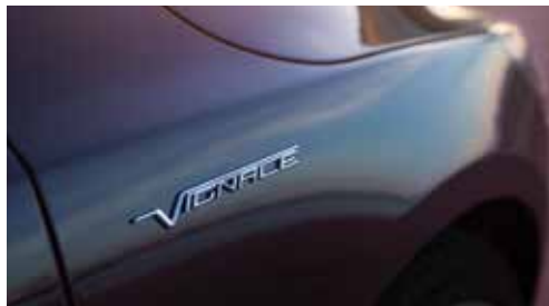
Emblemat Vignale na przednich błotnikach Standard