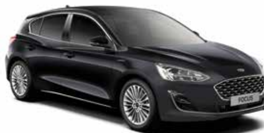
Shadow Black Lakier specjalny 1 450,-