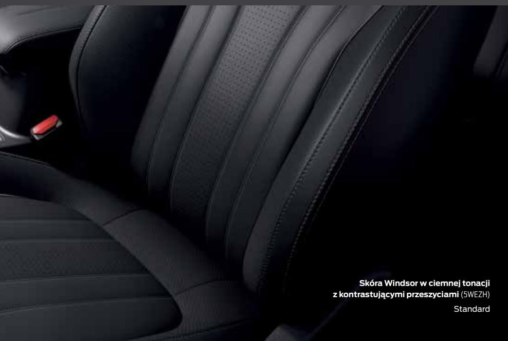
Skóra Windsor w ciemnej tonacji z kontrastującymi przeszyciami (SWEZH) Standard