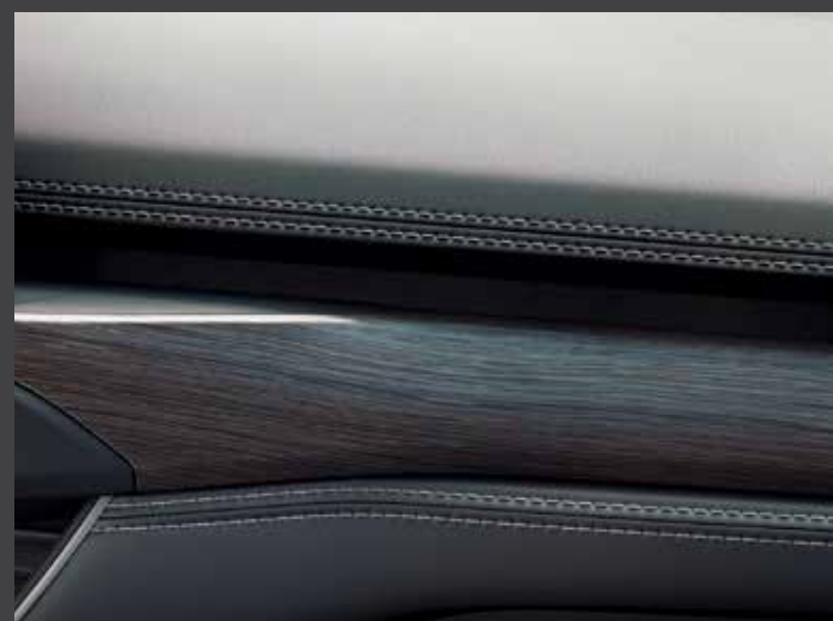
Deska rozdzielcza wykończona winylem Standard