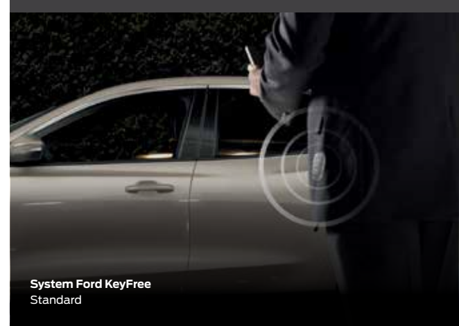
System Ford KeyFree Standard