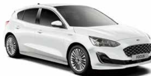
Frozen White Lakier zwykły bez dopłaty