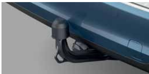
Hak holowniczy składany elektrycznie