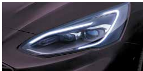
Adaptacyjne reflektory Full LED ze światłami drogowymi zapobiegającymi oślepieniu i sekwencyjnymi kierunkowskazami LED Opcja dostępna tylko w pakiecie Design 5 (AGGAF)