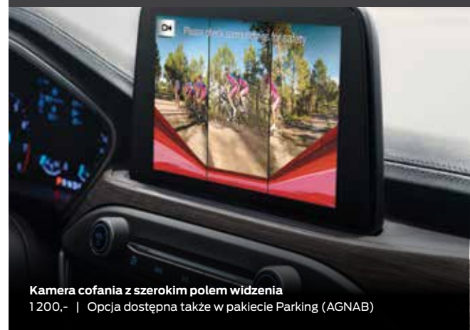
Kamera cofania z szerokim polem widzenia 1 200,- | Opcja dostępna także w pakiecie Parking (AGNAB)