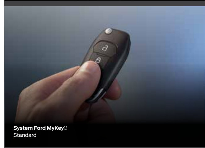
System Ford MyKey® Standard