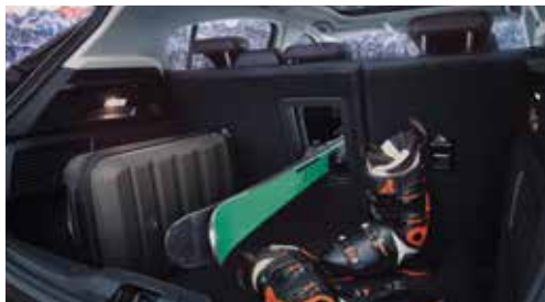
Tyłna kanapa - z otworem do przewozu nart i podtokiełnikiem Standard