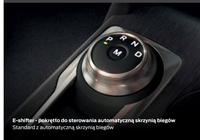
E-shifter - pokrętło do sterowania automatyczną skrzynią biegów Standard z automatyczną skrzynią biegów