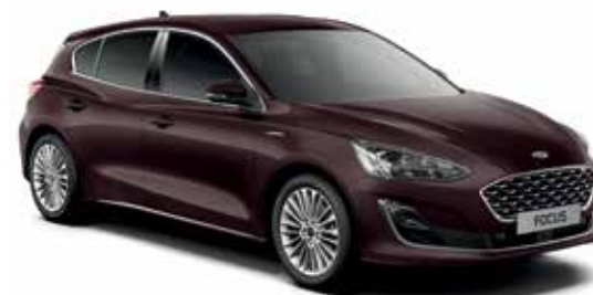
Dark Mulberry Lakier metalizowany specjalny 2 450,-