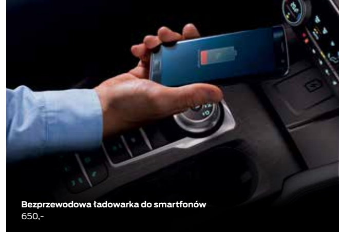
Bezprzewodowa ładowarka do smartfonów 650,-

● wyposażenie standardowe □ wyposażenie dostępne tylko w pakiecie lub z inną opcją