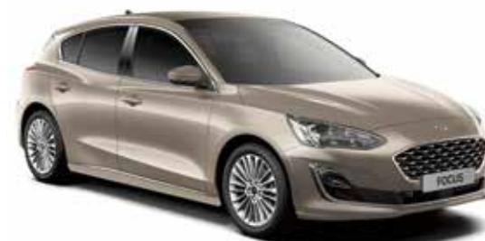
Diffused Silver Lakier metalizowany 1 950,-